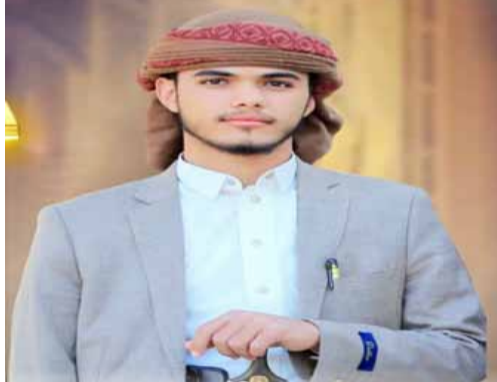
أحمد علي بنجاد

لما جين هذا التصريح مجرد كلمات عابرة، بل كان تعبيرًا عن رويته للأمة، بجسد ارتباطه العميق بالقياديا العادلة بعيدًا عن الحسابات السياسية والطائفية. وفي انتعاش فيه البعض بتقسيم الأمة وإثارة الفتى، كان نصر الله يبرش قيم الوحدة والكرامة، ويؤكد أن العدو الحقيقي هو الاحتلال وأدواته، وليس الشعوب التي تسعى لاستعادة حريتها وكرامتها. رحيل السيد حسن نصر الله لم يكن مجرد حدث عابر، كان زلزلة هز وجدان الأمة. فالقادة الصادقون لا يموتون، بل تتحول مداوهم إلى لغة لتلاحق الطغاة، وتصبح سيرتهم منهجًا للأجيال القادمة. في قلوب الأحرار، سظل السيد حسن نصر الله حيًا في كل ساحة المقاومة، في كل صوت يرفض الظلم، في كل يد تقبض على الزناد فداعًا عن الأرض والعرض. إن مواقفه لم تكن مجرد كلمات عابرة، بل دروسًا في العزة والكرامة والثبات. في الوقت الذي كان فيه كثيرون يخذلون غرة وهم يتسحق وتذبح، كان حزب الله يقدم الأبين العام تلو الأبين العام، متمسكًا بمواقفه الثابتة، لا يتراجع، وهذا هو ما يجعل التاريخ يكتب عنهم بحروف من ذهب.